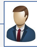
VACANTE GERENTE OFICINA "VILLAHERMOSA"