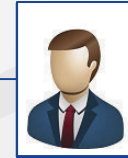
VACANTE GERENTE OFICINA "MONTERREY"