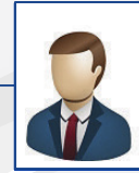
VACANTE GERENTE OFICINA "MONTERREY"